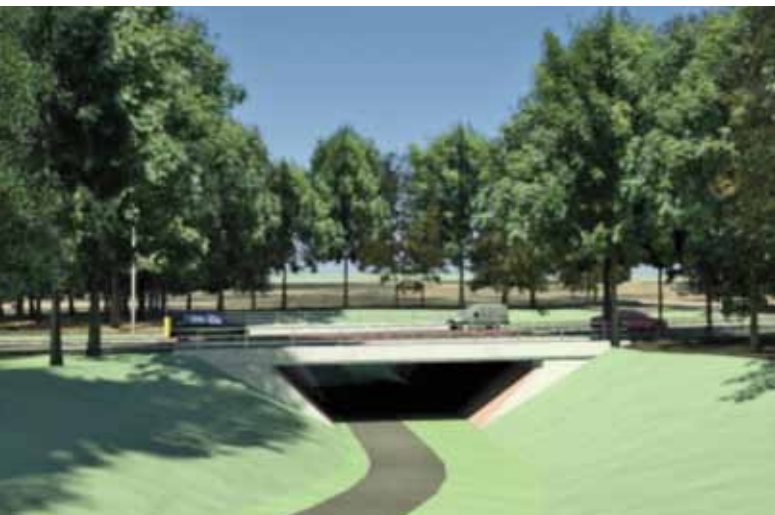
Zicht op de onderdoorgang vanaf de Zuiderheide

Om de aanleg van de bypass mogelijk te maken, zal de provinciale weg N525 in november voor korte duur (in de nachtelijke uren of het weekend) worden afgesloten voor