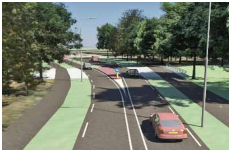
Zicht vanuit Hilversum richting Laren